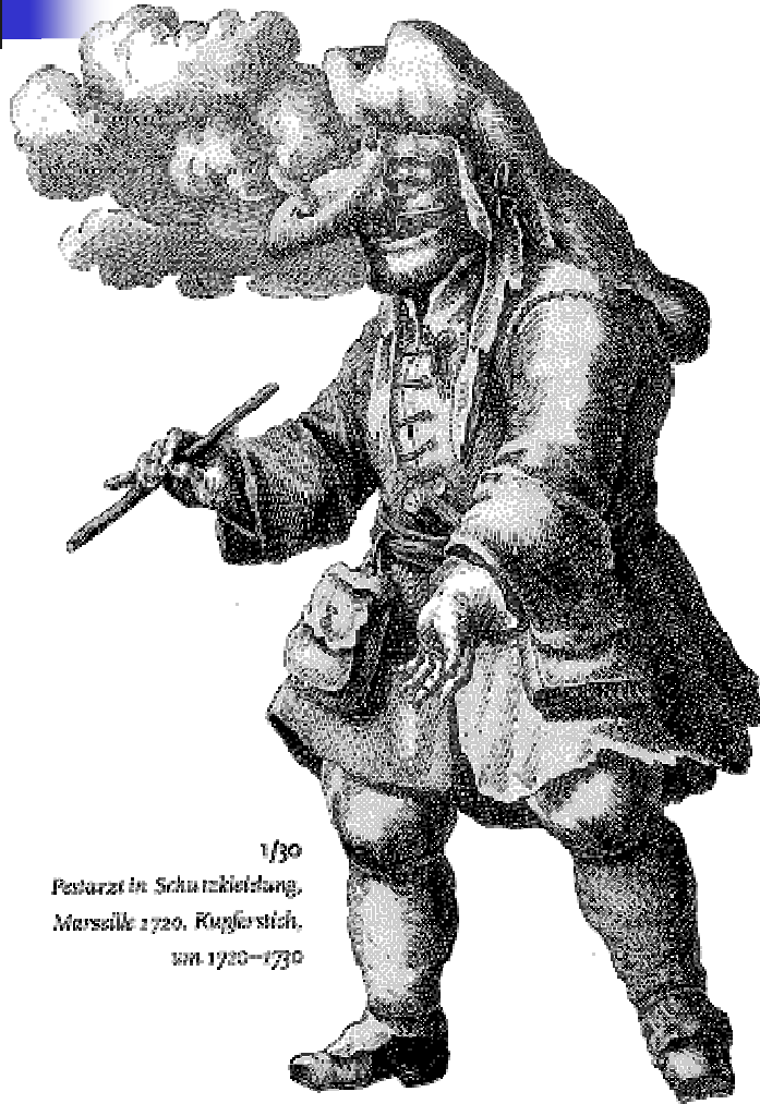
1/30 Pestarzt in Schutzkleidung, Marseille 1720. Kupferstich. um 1720-1730